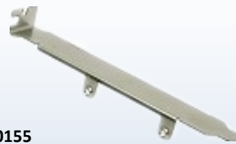
JP0155 (PCIe 標準高ブラケット) x1