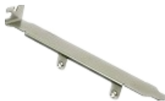
JP0155 x1 (PCIe 標準高ブラケット)