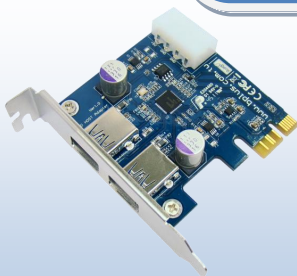
PP2U (2ポート PCIe2.0-USB3.0 拡張ボード) x1