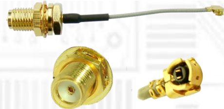
U.fl/IPX→SMA メス変換 RF ケーブル

ビープラス・テクノロジーは2009年3月以来、高品質のコンピュータ接続製品の製造業者として広範囲のアップグレード用製品を提供してきました。弊社製品はデスクトップ・ノートブック PC を問わず外部周辺機器との橋渡し役としてご好評いただいています。