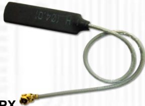
ANT0918-IPX (900/1800MHz 帯域対応 1dBi 内部 PCB アンテナ) x2