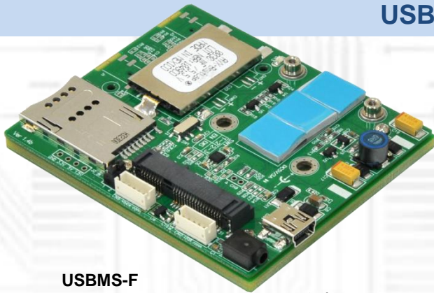
USBMS-F (無線通信 Mini Card 用 USB アダプタ) x1