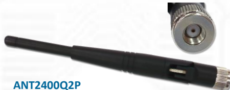
ANT2400Q2P 2.4GHz 2.15dBi ラバーダックアンテナ