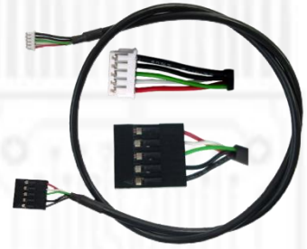
Y02-USB-099 (USB2.0 5 端子ヘッダー-専用 5 端子ケーブル)x1