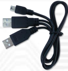
USB-Y-Line-2.0 (USB 2.0 Y 字ケーブル) x1