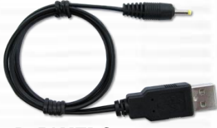
P25AMTDC60 (USB-5VDC 電源ケーブル) x1