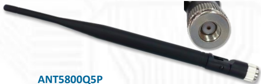
ANT5800Q5P 5.8GHz 5dBi ラバーダックアンテナ