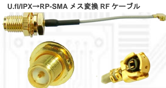
U.fl/IPX→RP-SMA メス変換 RF ケーブル