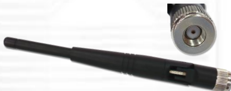
ANT2400Q2P 2.4GHz 2.15dBi ラバーダックアンテナ