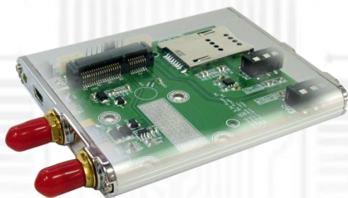
USBMS (無線通信 Mini Card 用 USB アダプタ ver.1.0) x1 IPX→RP-SMA メス変換 RF ケーブル: 2 本内蔵済