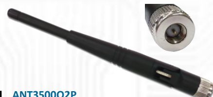
■ ANT3500Q2P 3.5GHz 2.5dBi ラバーダックアンテナ