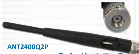
ANT2400Q2P 2.4GHz 2.15dBi ラバーダックアンテナ