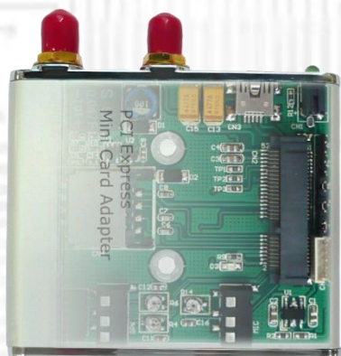
USBMV (無線通信 Mini Card 用 USB アダプタ ver1.3) x1 IPX→RP-SMA メス変換 RF ケーブル: 2 本内蔵済