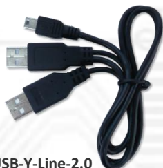
USB-Y-Line-2.0 (USB 2.0 Y字ケーブル) x1