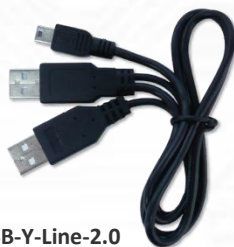
USB-Y-Line-2.0 (USB 2.0 Y字ケーブル) x1